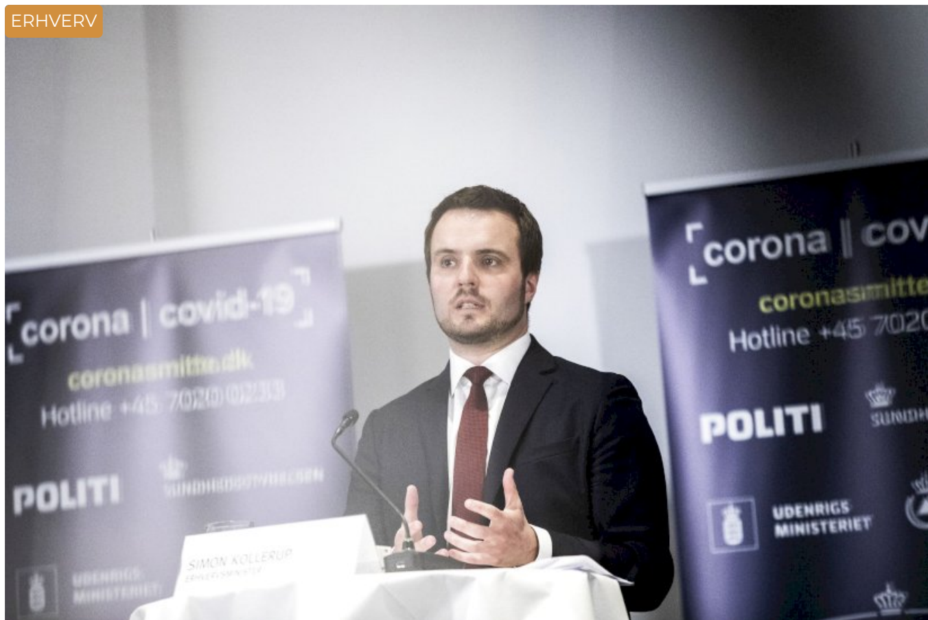
Nu ruller milliarder ud til virksomheder