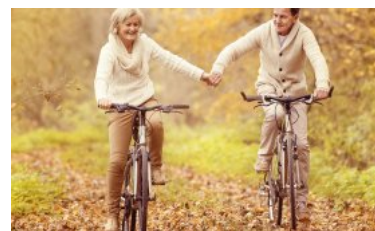
Guide: Vejen til det gode seniorliv