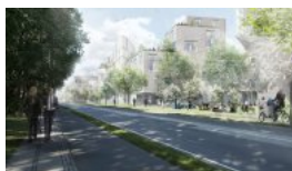
Danmarks Silicon Valley skal ligge i Lyngby