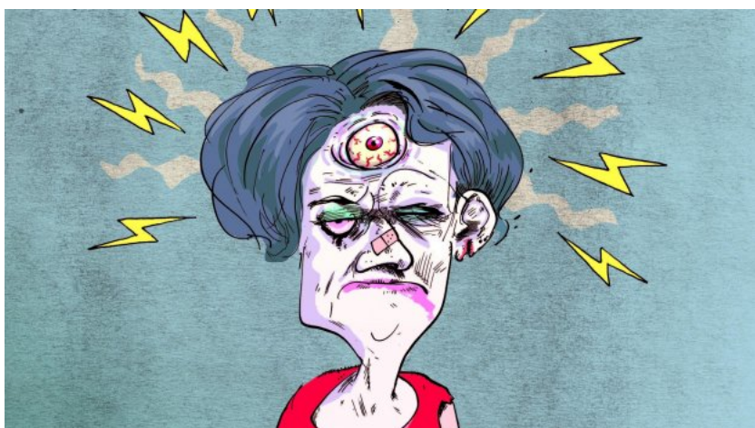
Tømmermænd giver en særlig stemning i byen, i samfundet, når så mange af dets borgere vågner med hoved på i forskellige grader, som tilfældet er den 1. januar. Tegning: Claus Bigum