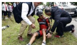
BMC-rytter overfaldet med kniv og røvet på træningstur