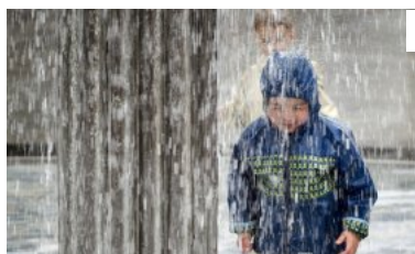
UV-filer i regntøj gør drenge sterile