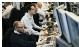
Sådan rammer aktieskatten danskerne