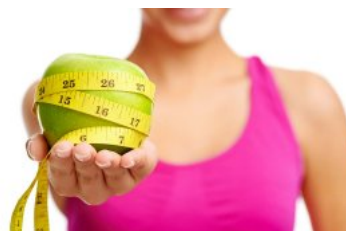
SLANKE-SUCCES: Vælg den rigtige kur og tab dig