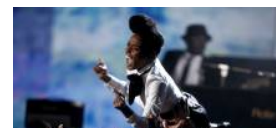
Guide: Sommerens sidste festivaler