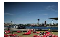
Guide: Hæng ud på Københavns store by