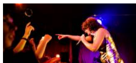
Klublisten: Her er 5 gode fester i weekenden