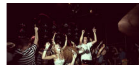
Guide: København kammer over af seje festivaler