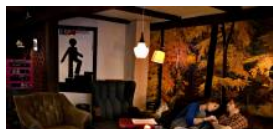
Guide: spis med god samvittighed på byens velgørenhedscafeer