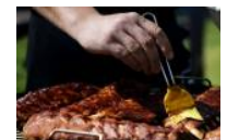
Guide: Her er byens 1 grillsteder